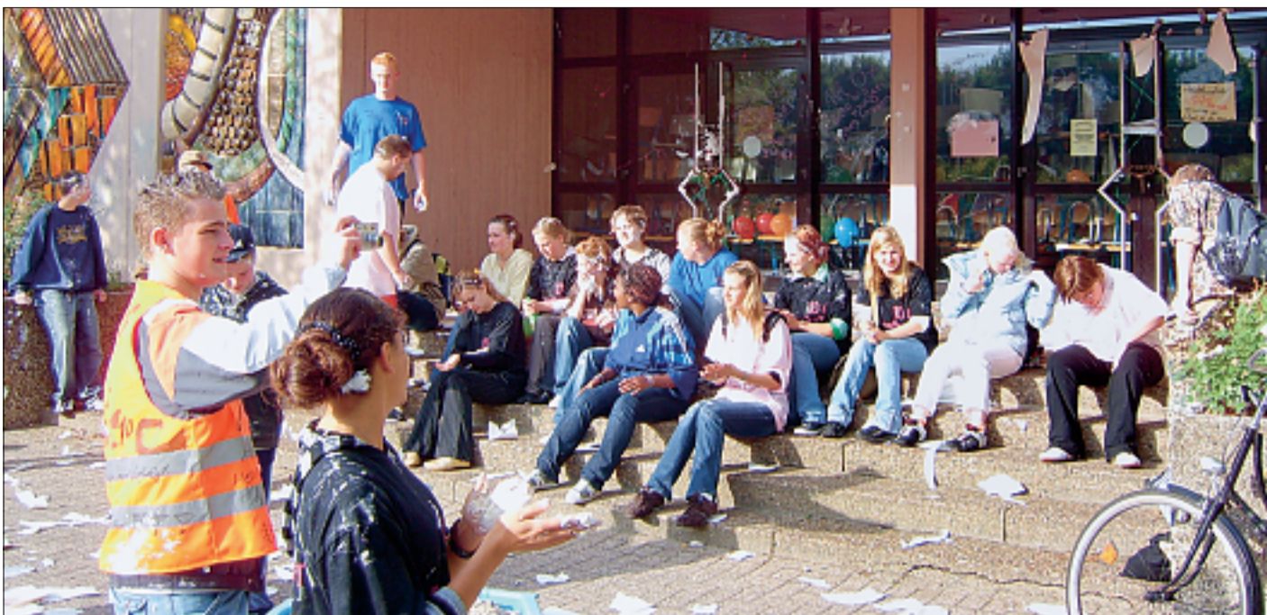
Die Hauptschüler spielten den Lehrern gestern einen Streich. Außerdem seiften sie sich mit Rasierschaum und anderen Mitteln kräftig ein.

„Wir haben zwei Säcke Kronkorken, drei Säcke Zigarettenschachteln, zwei große Pakete mit Klopapier und zwei Rollen Flatterband entleert“, erzählten die Schüler.